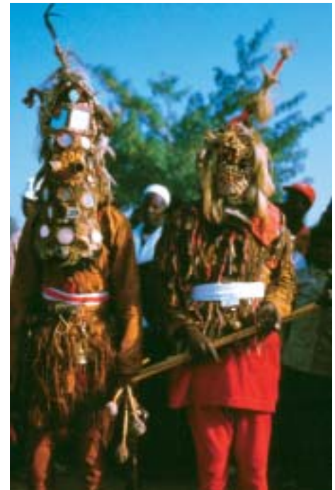
Masques des esprits de la forêt chez les Malinké de Haute-Guinée. Les masques sortent à l'occasion des cérémonies de circoncision. Au-delà de l'aspect exotique, ceux-ci véhiculent des valeurs sociales bien plus importantes que leur esthétique.

Il a donc fallu près de dix ans pour mettre au point un système viable. Mais à chaque projet, le sentiment de repartir à zéro demeure. En effet, si je choisis librement mes sujets d'étude, il faut ensuite trouver les lieux d'expositions, convaincre des sponsors, décider des spécialistes pour qu'ils apportent leur collaboration, intéresser des éditeurs et produire des expositions adaptées au lieu et au public visé. C'est, à chaque fois, une petite entreprise qui se monte patiemment. A cela s'ajoute la pression saine de devoir être efficace car la qualité du résultat en dépend. Chaque acte effectué sur le terrain doit déboucher sur un résultat directement utilisable. La rentabilité, même dans une discipline comme celle-ci, n'est pas forcément incompatible. L'exercice nécessite aussi qu'on soit le plus objectif possible. Dresser le portrait d'une ethnie ne peut pas être un acte empreint de romantisme ou le moyen d'exprimer ses propres convictions. Le but reste d'établir un travail de référence dénué d'a priori. Cela n'empêche pas d'évoquer des polémiques ou de dénoncer des situations. Par exemple, chez les Maasaï, qui ont été chassés des réserves, de celle du Ngorongoro par exemple, il était impossible de soutenir la politique des parcs nationaux en matière de protection de la faune, dès lors que les intérêts des éleveurs divergeaient.