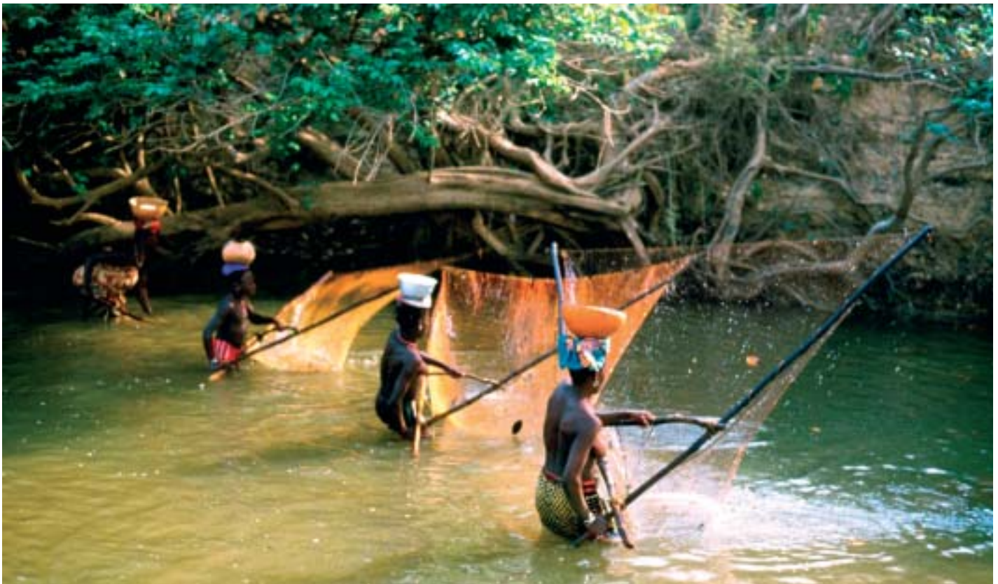
Jeunes filles pratiquant la pêche lors de la décrue, Guinée