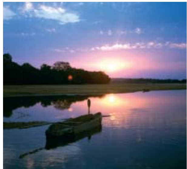
Coucher de soleil sur le Sangarani en pays bambara au Mali. L'aspect des pirogues dépend des essences disponibles et de la nature du fleuve.

Pour en savoir plus : www.cultures-com.org