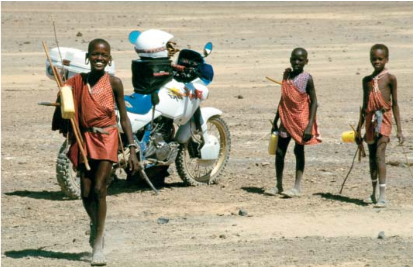
En 650cc chez les Maasaï, un moyen de passer partout et d'éviter les locations onéreuses de 4x4 durant 3 années de terrain. Berges du Lac Saley, Tanzanie

En Ethiopie, pour visiter des monastères, véritables nids d'aigles, il m'a fallu traverser le nord du pays à pied. Là où même un cheval ne peut passer, il faut crapahuter dans les montagnes. Ecrasé par le soleil, économisant une eau trop rare, soumis à d'importants écarts d'altitude, à la merci des bandits, les conditions de travail ne sont pas toujours idéales. Guidé par d'anciens rebelles, les journées n'en finissent pas : parfois jusqu'à 15 heures de marche, eux pieds nus, moi avec de grosses godasses dans la caillasse des chemins de montagne. Et puis, il faut se lever très tôt, 4 heures du matin, pour assister aux messes qui durent plusieurs heures. Les villages sont