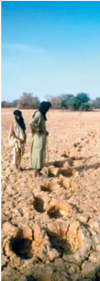
Traces du passage d'éléphants en pays targui à Hombori au Mali après une trop rare pluie. La cohabitation reste pacifique entre le troupeau de pachydermes le plus septentrional d'Afrique et les éleveurs Touaregs.

l'état. Si l'Afrique possède encore une telle diversité culturelle, c'est aussi parce que tous ces peuples spécialisés échangent entre eux. Ainsi sur les marchés du Mali, on peut voir les pêcheurs Bozo fournir le poisson, les Peuls apporter la viande sur pied, les Dogon vendre du mil et des oignons, les Bambara, du beurre de karité et des tissages, les Songhaï des poteries et des outils et les Touaregs proposer leurs services comme transporteurs. Tous ont intérêt à maintenir de bonnes relations parfois mises à mal par les aléas du climat.