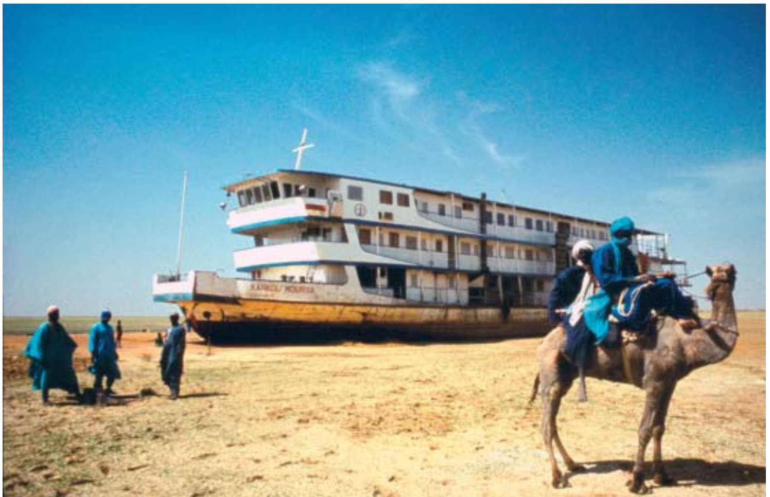
Bateau de la ligne Mopti - Gao ensablé dans les sables du Lac Debo au Mali. Ce delta intérieur, vestige d'une mer autrefois très étendue, pouvait couvrir 70 km sur 30 de large. Les barrages et la sécheresse des années 70 et 80 ont considérablement diminué le niveau des eaux et, de ce fait, la navigation sur le fleuve. Attiré par cette masse sombre qui se dégageait au loin, je pensais qu'il s'agissait d'un village. Les Touaregs rendaient visite au gardien du bateau bloqué depuis des mois.